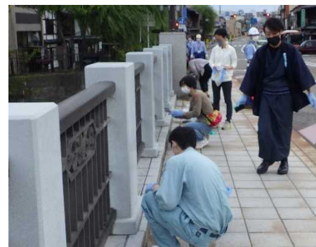
【昨年の浅野川大橋 清掃活動の様子】