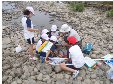
つかまえた生き物を分類