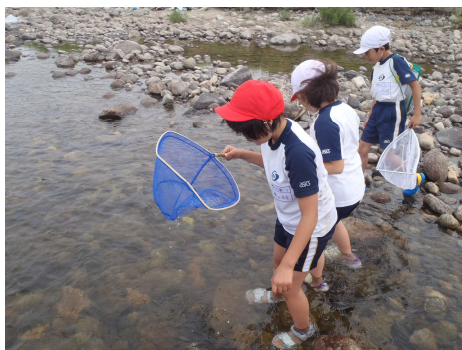
川にすむ生き物を採取