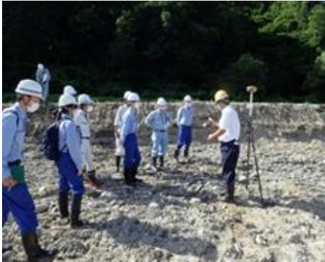
実施状況イメージ

参加機関：置賜森林管理署、下越森林管理署村上支署、山形県、新潟県、小国町、関川村、飯豊山系砂防事務所