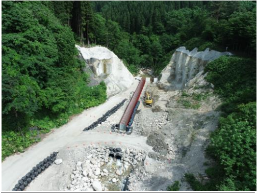
藤沢川第3号砂防堰堤施工状況

※取材希望者は別紙「取材申込書」にて事前に申し込みをお願いします。 ※天候等による中止の判断は、当日朝 9:00 に行います。 ※発熱などの症状がある方は来場をお控えください。