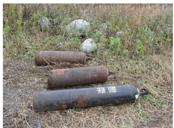
粗大ゴミ（酸素ボンベ 他2本）