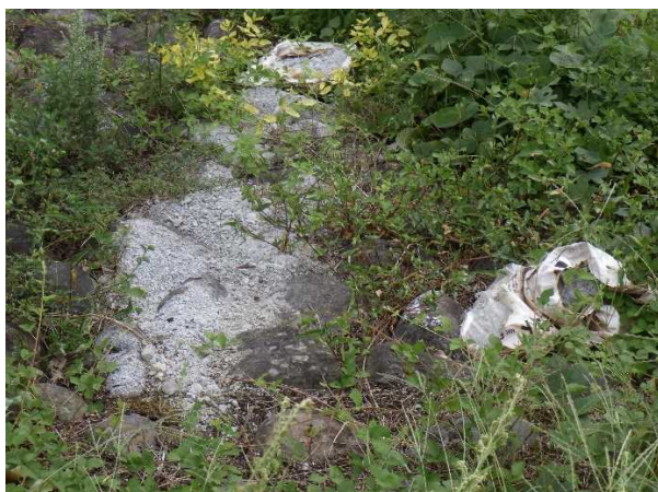
粗大ゴミ（セメントのくず）