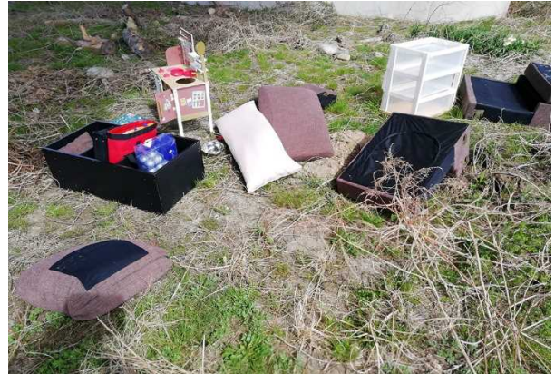
粗大ゴミ（ソファ、収納ボックス他）