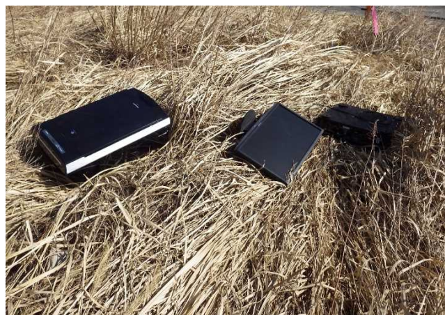
粗大ゴミ（空気清浄機、液晶モニター他）