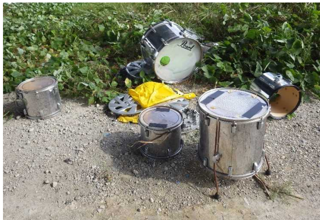
粗大ゴミ（楽器：ドラム他）