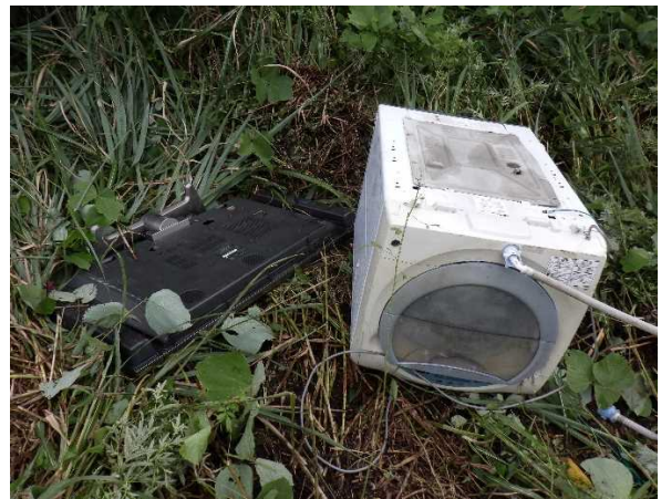
粗大ゴミ（テレビ、洗濯機）