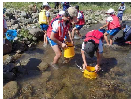
川にすむ生きものを採集

詳細は、 https://www.mlit.go.jp/report/press/mizukokudo04_hh_000211.html