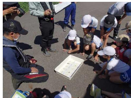
採集した水生生物を判定