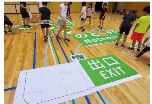
実物大の標識パズル(イメージ)