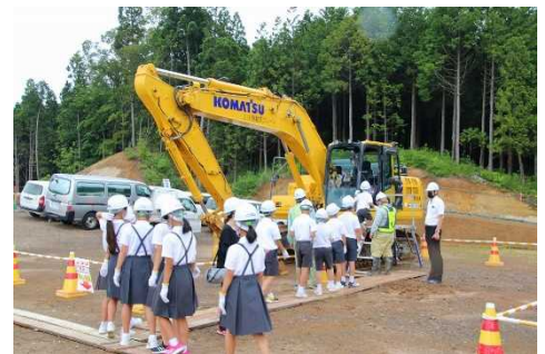
小学生の現場見学会(過年度の様子)