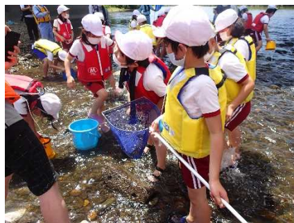
川にすむ生きものを採集

詳細は、 https://www.mlit.go.jp/report/press/mizukokudo04_hh_000211.html