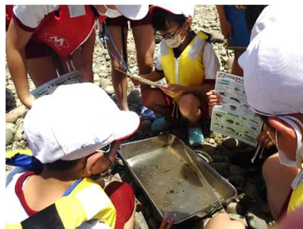
採集した水生生物を判定