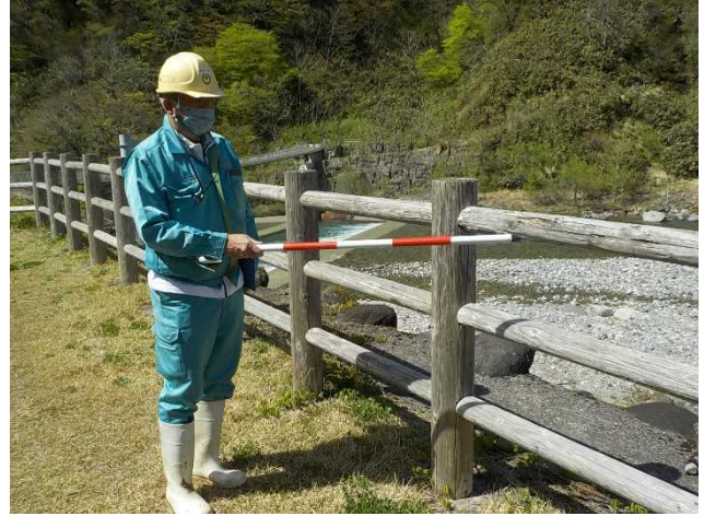
安全利用点検より不具合箇所確認 (常願寺川水辺の楽校)

■ゴールデンウィーク前(4月)の点検結果と対応 木製バリケード等の破損 → 取り替えや補修を実施 河道内などの危険箇所への立入防止が必要 → 立入防止対策を実施 「こころの架け橋の清掃必要」 → 清掃を実施