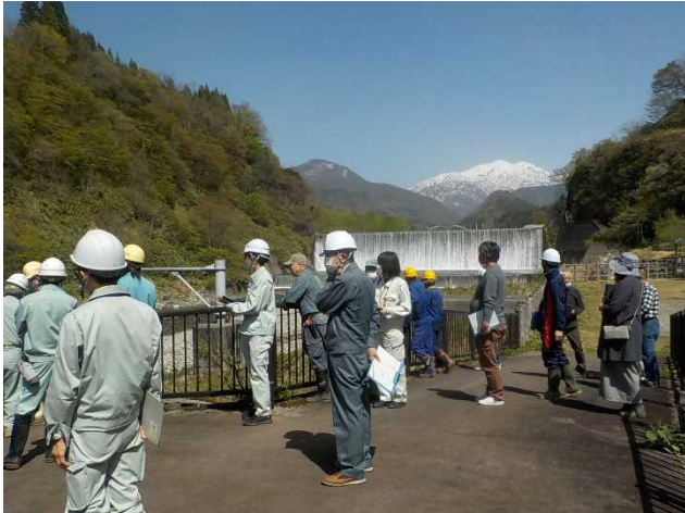
参加者33名で安全利用点検を実施 (常願寺川水辺の楽校)