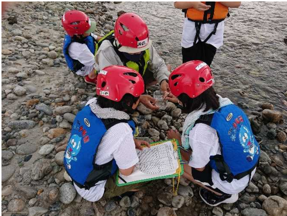
令和4年度 下流部調査