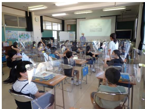
令和4年の出前講座 熊野川の生物・水質について