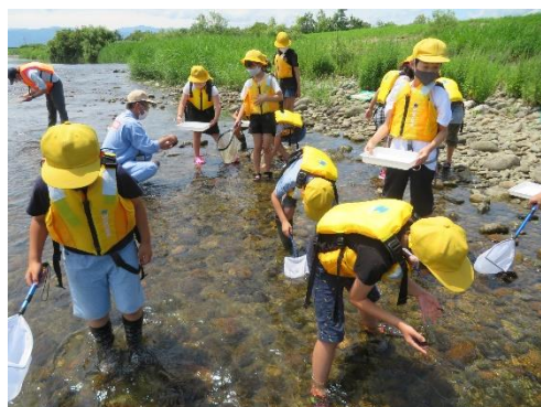
令和3年の水生生物調査