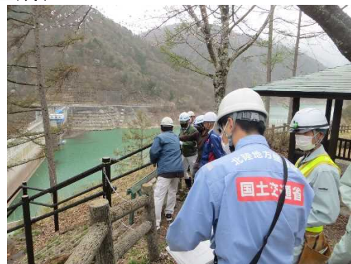
前回の安全利用点検状況(GW前 R5. 4. 14 実施)