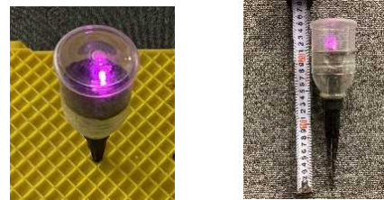
ペットボトル(高さ20cm)