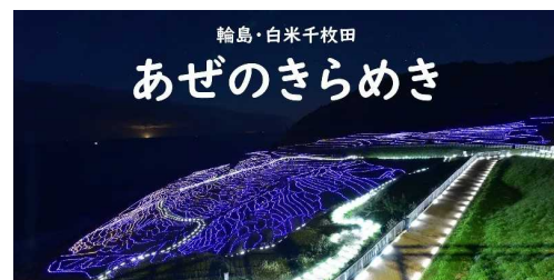
あぜのきらめき(千枚田)輪島市HPより