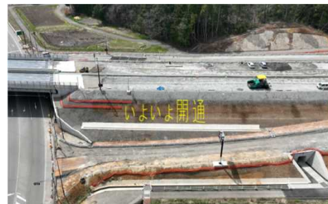
ペットボトル設置イメージ