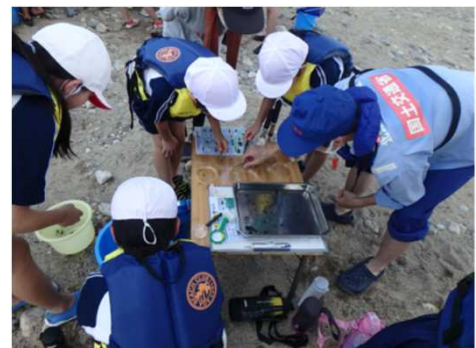
つかまえた生き物を分類