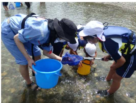
川にすむ生き物を採取