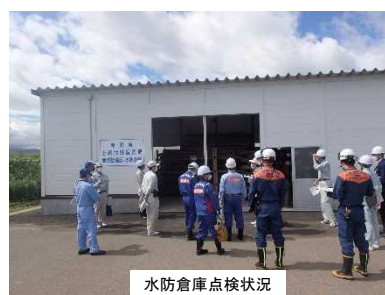
水防倉庫点検状況