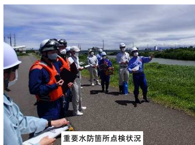
重要水防箇所点検状況