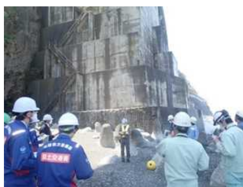
海岸擁壁の遠望確認