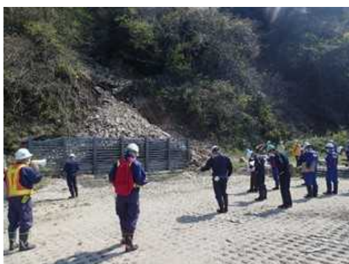
洞門上斜面の落石・崩壊箇所確認