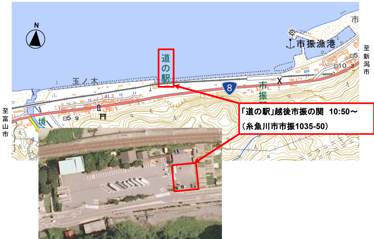
新潟市側の駐車場に集合下さい