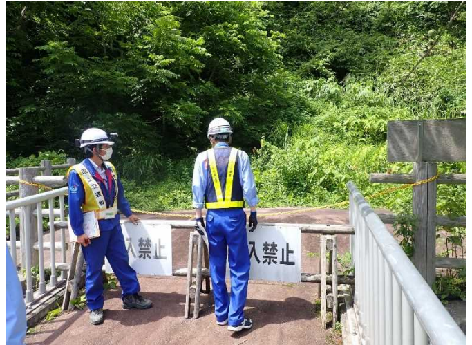
安全利用点検を行う参加者 (常願寺川水辺の楽校)

■夏休み前(6月)の点検結果と対応 立入禁止措置施設の腐朽 → 立入禁止措置施設の交換 こころの架け橋に動物の糞が点在 → 動物の糞の撤去および清掃