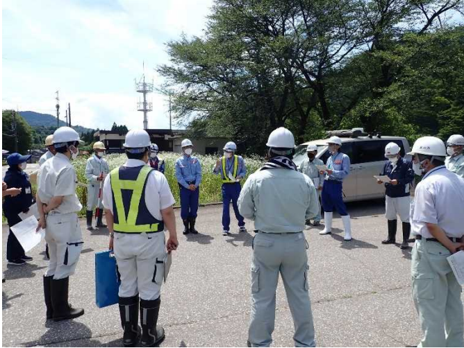
参加者18名での点検箇所・項目の確認 (常願寺川水辺の楽校)