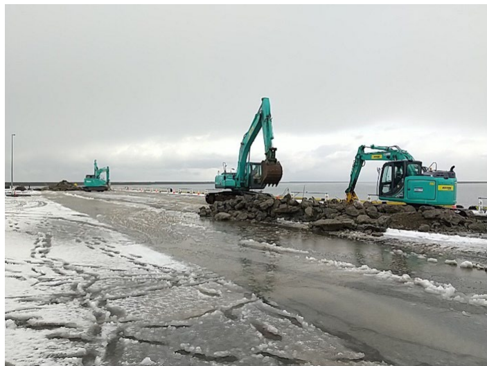
②応急復旧工事施工状況(舗装版取り壊し(2/6(火)撮影))