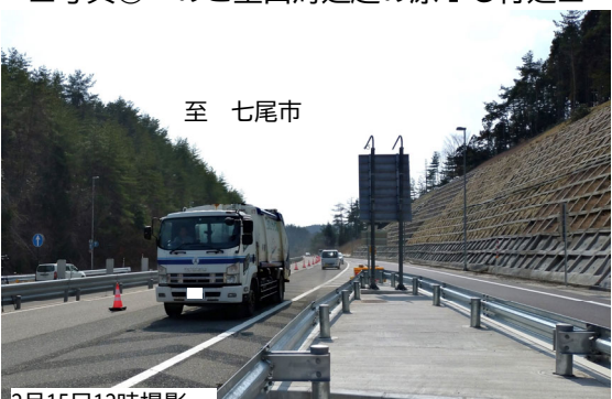
■写真② のと里山海道越の原IC付近