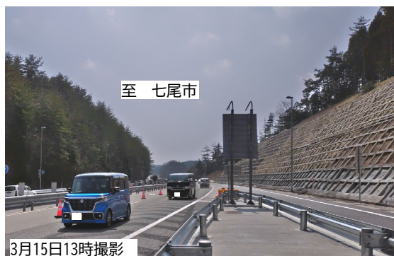
■写真① のと里山海道越の原IC付近

※今後の余震や天候状況により 通行止めとする場合 があります。 通行する際は最新の交通情報をご確認 するようお願いします。