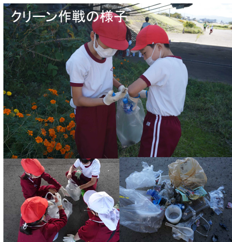
クリーン作戦の様子

※順延・中止の場合は、当日朝決定されますので、 高田河川国道事務所X(旧Twitter)でお知らせします