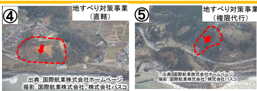
R249地すべり(輪島市大野町・深見町) 【国交省】清水建設