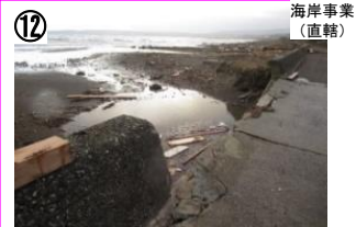
宝立正院海岸 【国交省】五洋建設