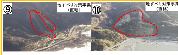
R249地すべり(珠洲市仁江町・清水町) 【国交省】前田建設