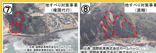
R249地すべり (輪島市洪田町・町野町曾々木) 【国交省】大林組