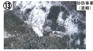
寺地川(輪島市町野町) 【石川県】清水建設 【国交省】飛島建設