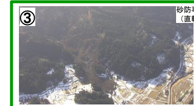
紅葉川(輪島市市ノ瀬町) 【石川県】鹿島建設 【国交省】鹿島建設