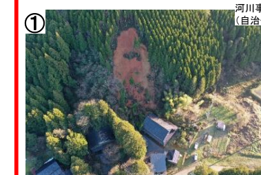
広地川(志賀町広地) 【志賀町】五洋建設