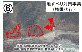
R249地すべり (輪島市名舟町) 【国交省】大成建設