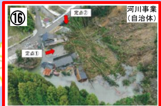
山田川(能登町宮地) 【石川県】佐藤工業