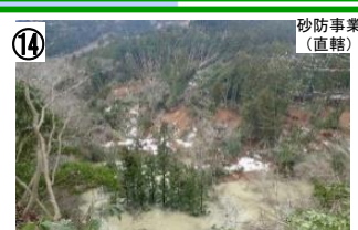
牛尾川(輪島市町野町) 【国交省】フジタ