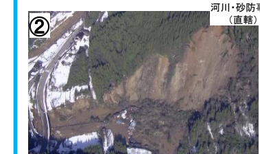
河原田川(輪島市熊野町) 【石川県】鹿島建設 【国交省】鹿島建設