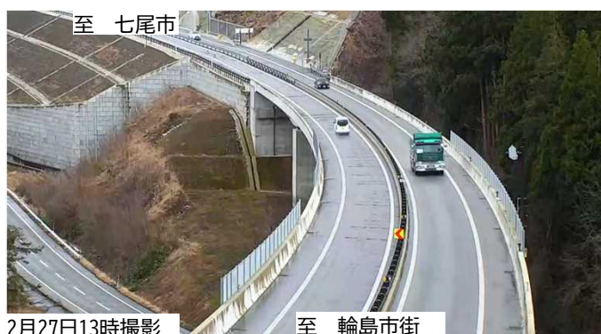
■写真① 輪島市三井町小泉高架橋付近■

※今後の余震や天候状況により 通行止めとする場合があります 。 通行する際は最新の交通情報をご確認 するようお願いします。