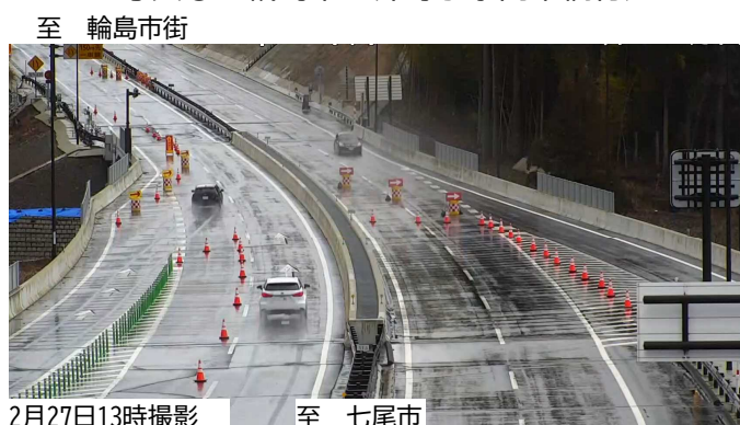
■写真② 輪島市三井町ののと里山空港IC付近■