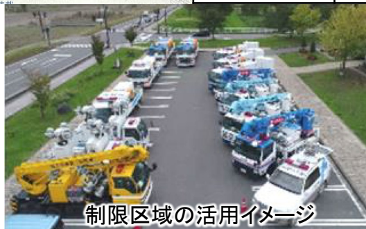
制限区域の活用イメージ