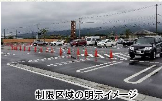
制限区域の明示イメージ