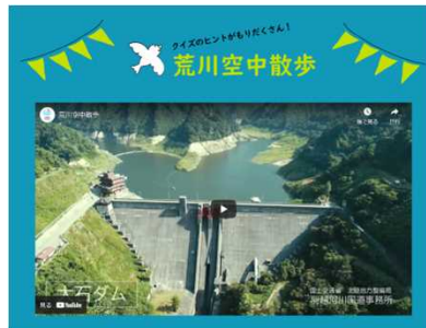
荒川や大石・横川ダムの空中映像