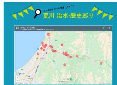
荒川周辺の史跡などの紹介