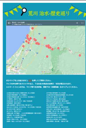
荒川治水・歴史めぐり