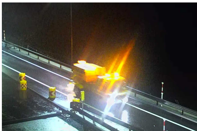
国道470号能越道 のと三井IC (輪島市三井町本江付近)