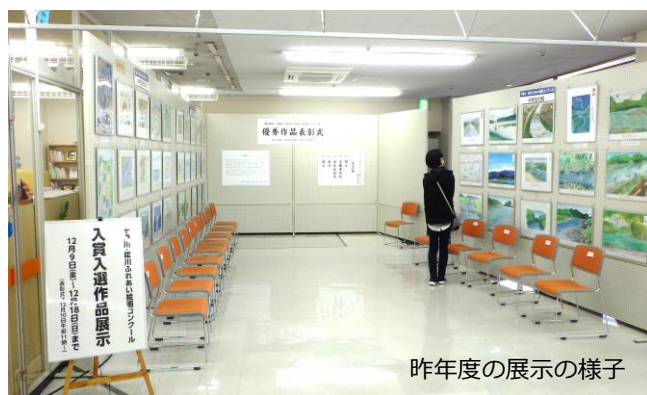
昨年度の展示の様子