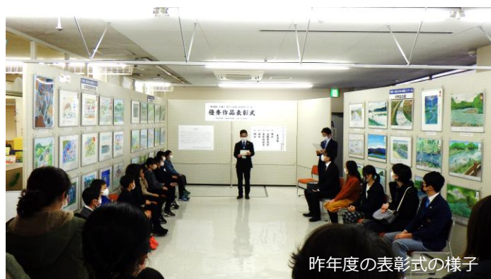
昨年度の表彰式の様子