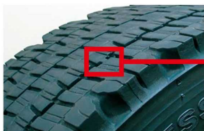
プラットホームとは新品時の溝深さから50%の位置にあるゴムの盛り上がりを設置した部分。