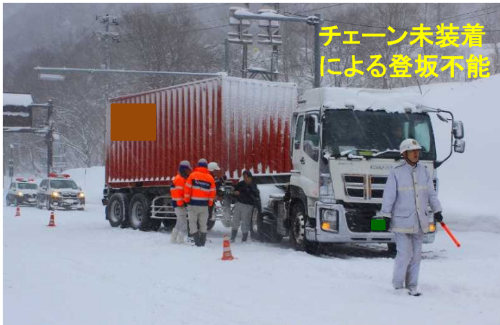
チェーン未装着 による登坂不能