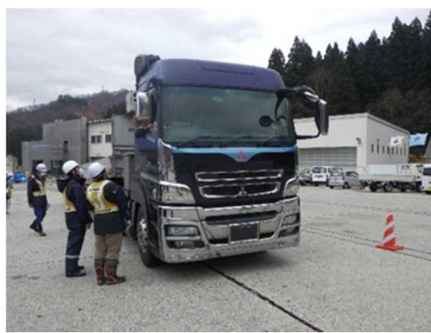
チェーン装着啓発活動(令和4年11月22日)