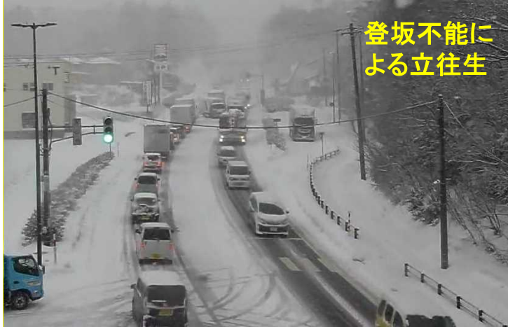
登坂不能に よる立往生