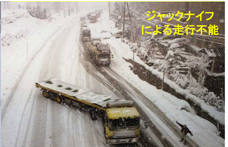
ジャックナイフ による走行不能