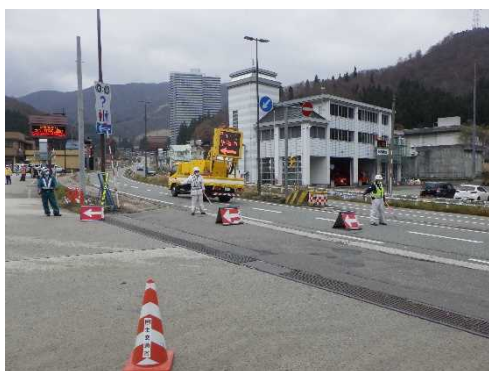
車両の引き込み訓練(令和4年11月22日)