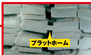
残り溝深さが「プラットホーム」に達していると冬用タイヤとして使用できません。