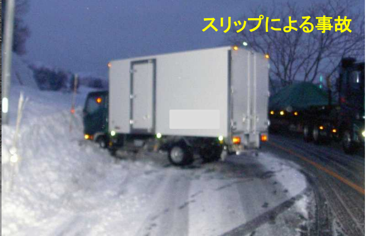
スリップによる事故