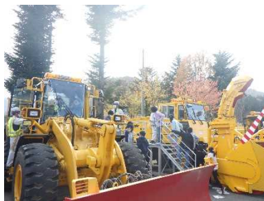
除雪機械への体験乗車