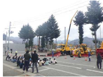
除雪機械の試運転・説明