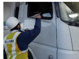
昨年度の訓練状況 (大型車チェーン装着指導訓練)