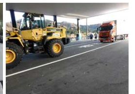
昨年度の訓練状況 (立ち往生車両けん引訓練)