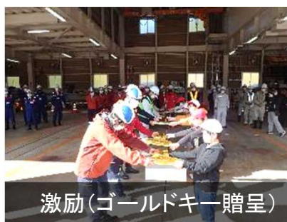
激励(ゴールドキー贈呈)