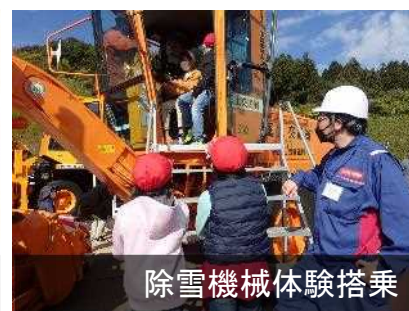
除雪機械体験搭乗