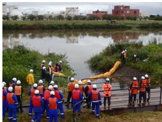
令和4年の様子(オイルフェンス設置訓練)