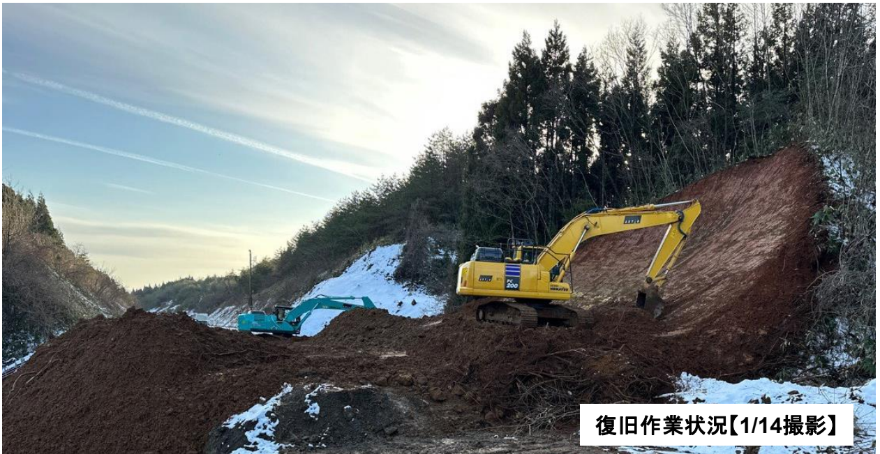
復旧作業状況【1/14撮影】