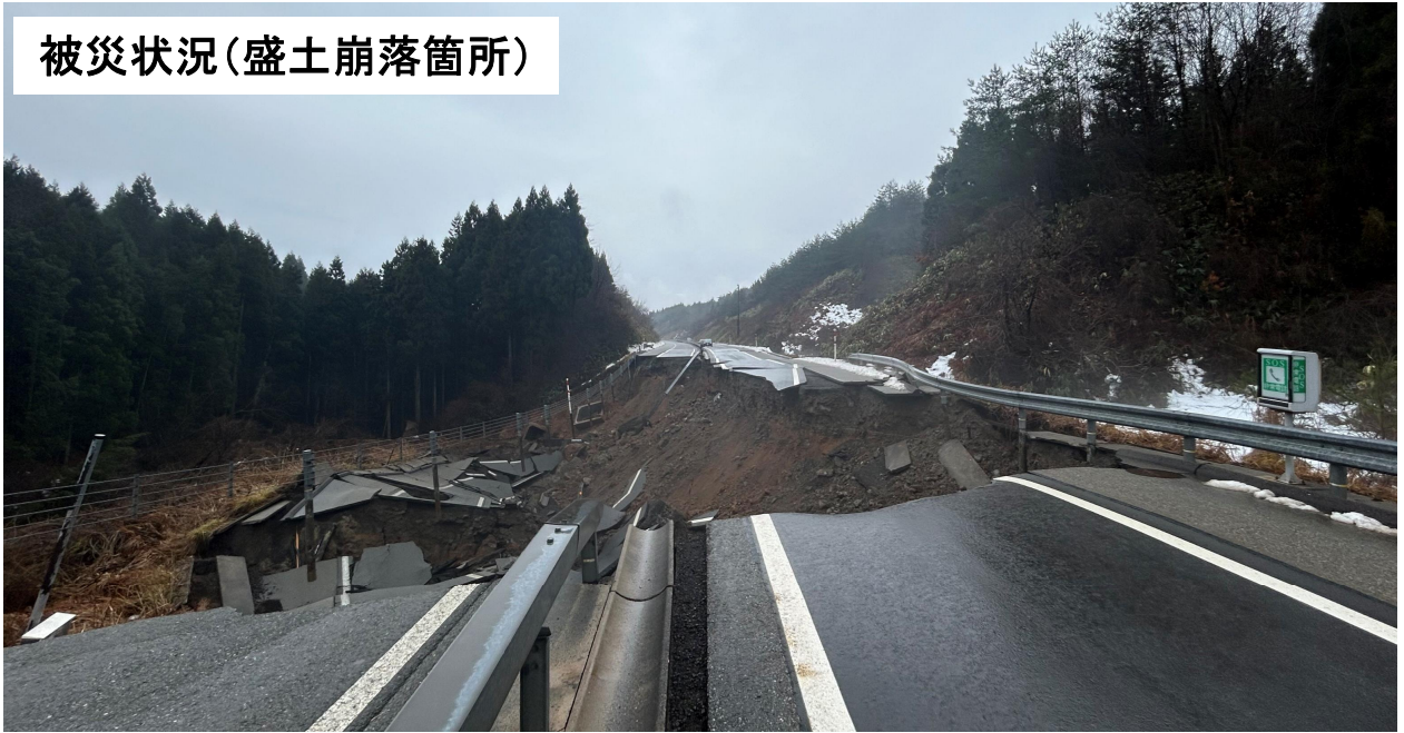
被災状況(盛土崩落箇所)