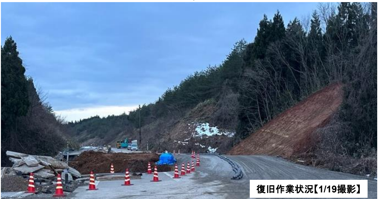
復旧作業状況【1/19撮影】