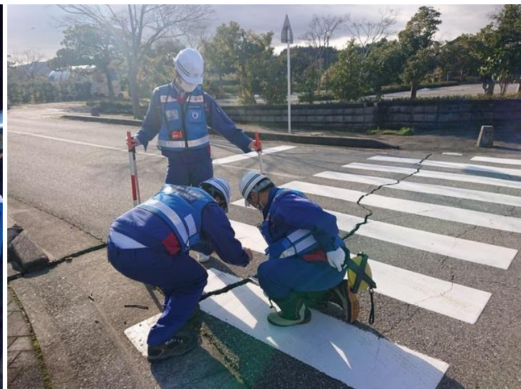
石川県珠洲市宝立町