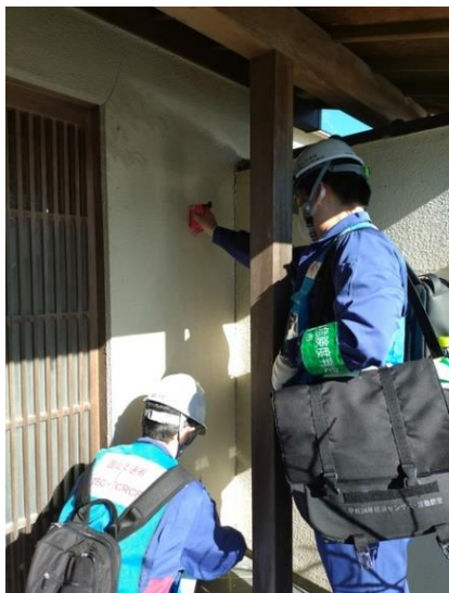
新潟県新潟市西区寺尾