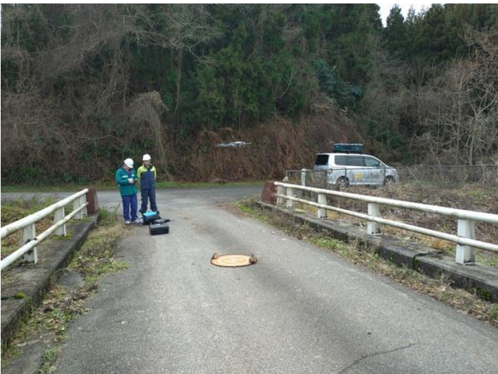
石川県穴水町諸橋