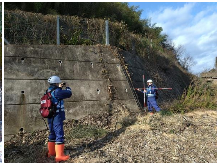
石川県能登町鵜川大工町