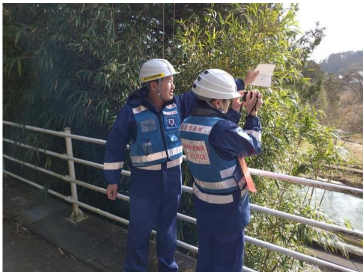
石川県能登町鵜川神出町