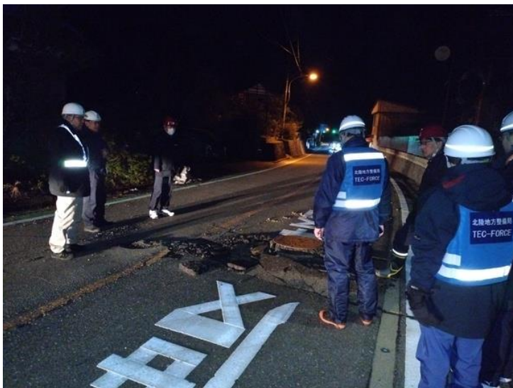
石川県珠洲若山町出田