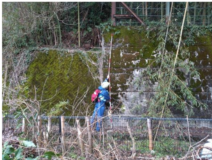
石川県能登町鵜川神出町