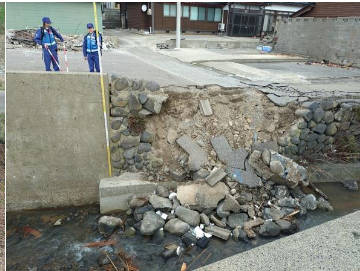
石川県志賀町前浜