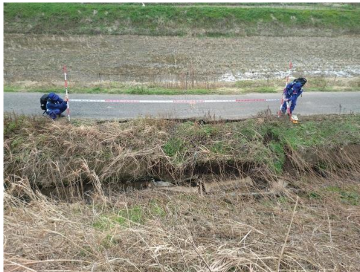
石川県志賀町笹波