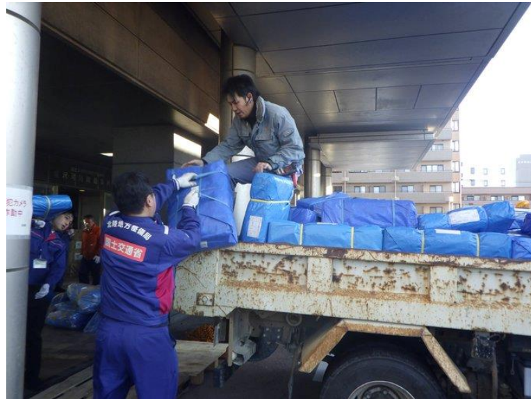
金沢河川国道事務所から 珠洲市、輪島市、穴水市、能登町へ 水、食料、ブルーシート等を輸送

北陸地方整備局管内の各事務所から被災地に向けて飲料水、非常食、ブルーシート等の物資支援を行いました。