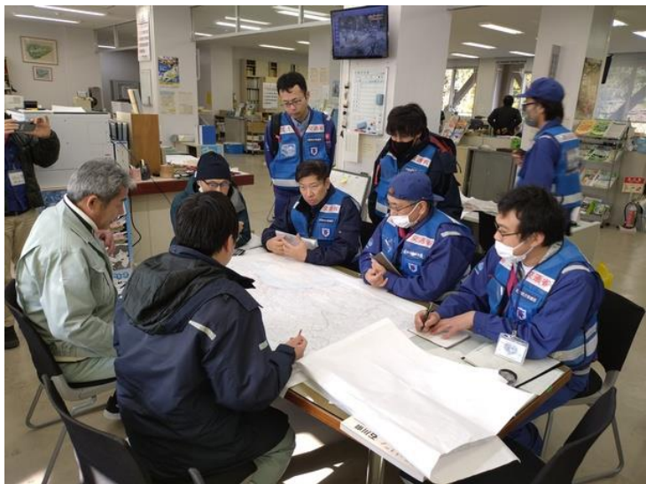
石川県珠洲市役所