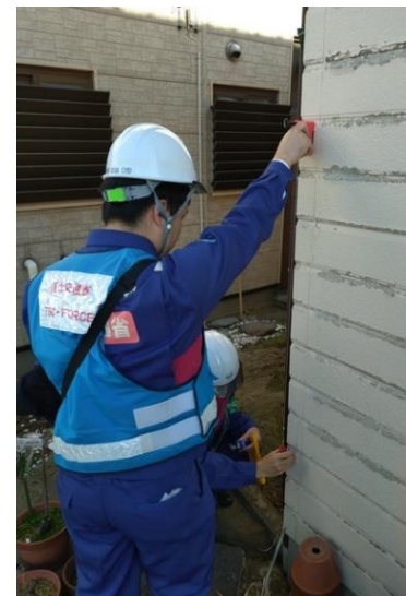
新潟県新潟市西区寺尾