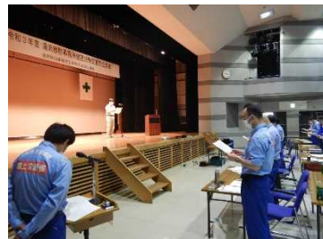
令和3年度大会の様子（写真左：開会挨拶、写真中央：講演、写真右：安全宣言唱和）