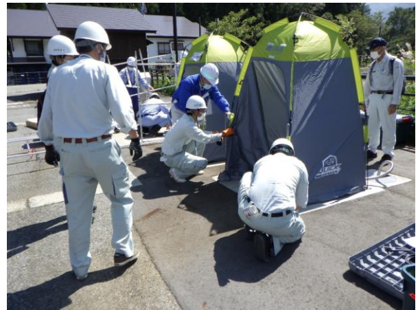
【非常用トイレの組み立て】 非常用トイレの組み立て方法を確認し、設営訓練を実施