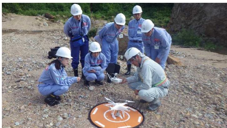
ドローン操作体験