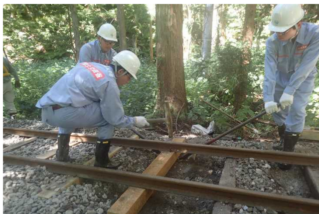
砂防工事現場体験3 (枕木交換体験)