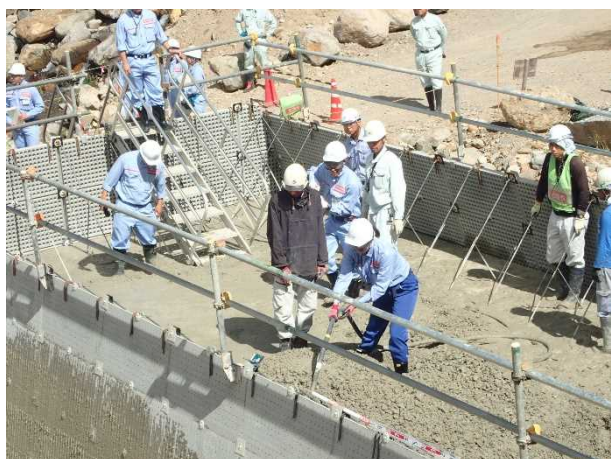
砂防工事現場体験1 (コンクリート打設体験)