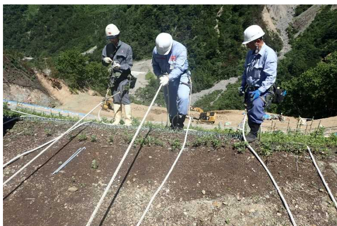
砂防工事現場体験2 (ロープ作業体験)