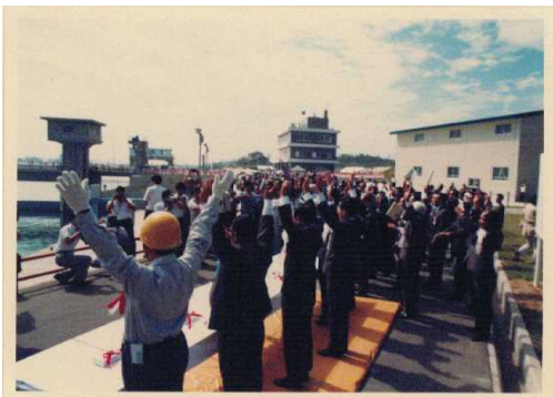
<50年前の式典の様子>