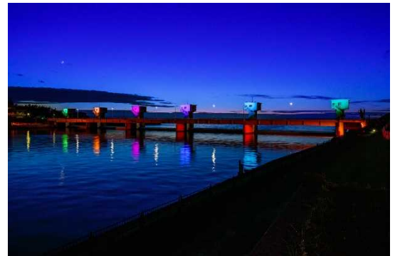
ライトアップされた新潟大堰

横田切れは、1896年(明治29年)7月22日に発生した、信濃川の堤防決壊による洪水です。数日間続いていた大雨により信濃川の水嵩が増大し、新潟県西蒲原郡横田村(現・燕市横田)の堤防をはじめ多くの堤防が決壊しました。これにより新潟市関屋までの広い範囲が浸水しました。