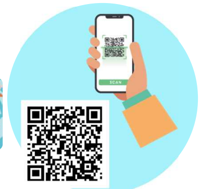
せきぶんクイズラリー 参加QRコード