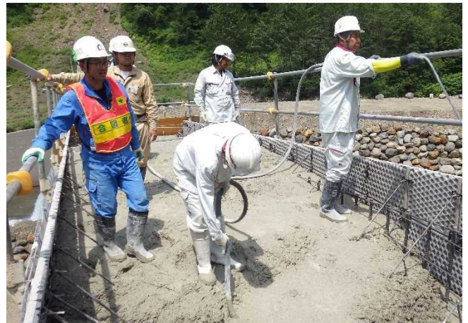
砂防堰堤のコンクリート打設