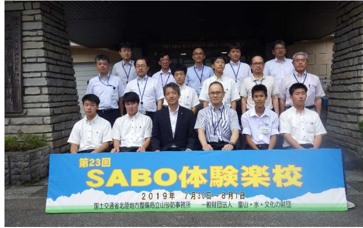
開校式後の記念撮影