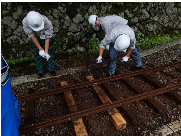
軌道での枕木交換