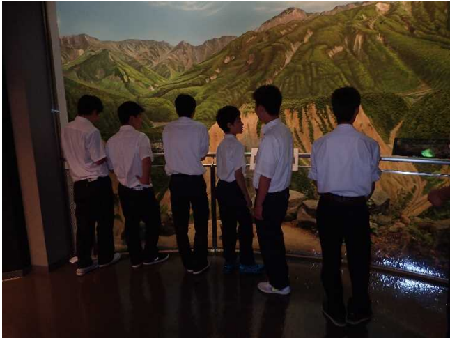
立山カルデラ砂防博物館見学