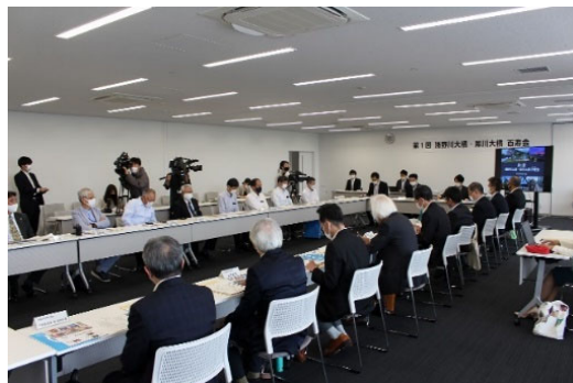
【前回の百寿会の様子】