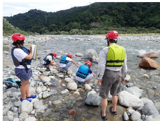
令和3年度 中流部調査