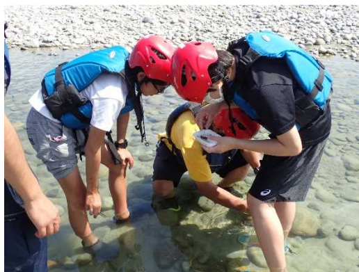
令和3年度 下流部調査