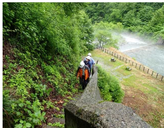
梅花皮沢第4号砂防堰堤 点検状況