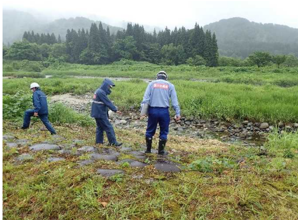
荒川流路工 護岸部 点検状況