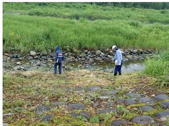
荒川流路工 護岸水際部 点検状況