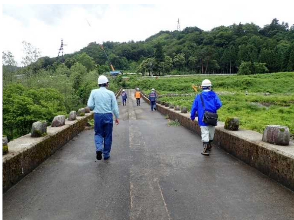
玉川スーパー暗渠砂防堰堤 点検状況