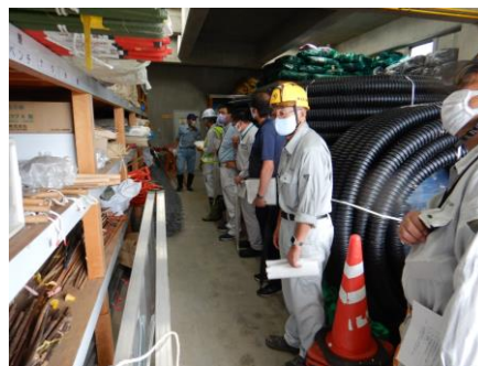
水防倉庫の備蓄材を確認 【塩川水防倉庫】