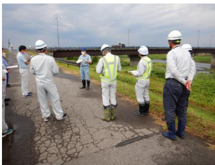
危険箇所での出水時の対応を確認 【会津坂下町青木】