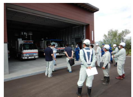
ポンプ車・照明車を確認 【南四合災害対策車庫】