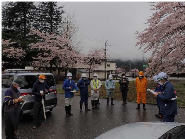
参加者15名での点検箇所・項目の確認 (常願寺川水辺の楽校)