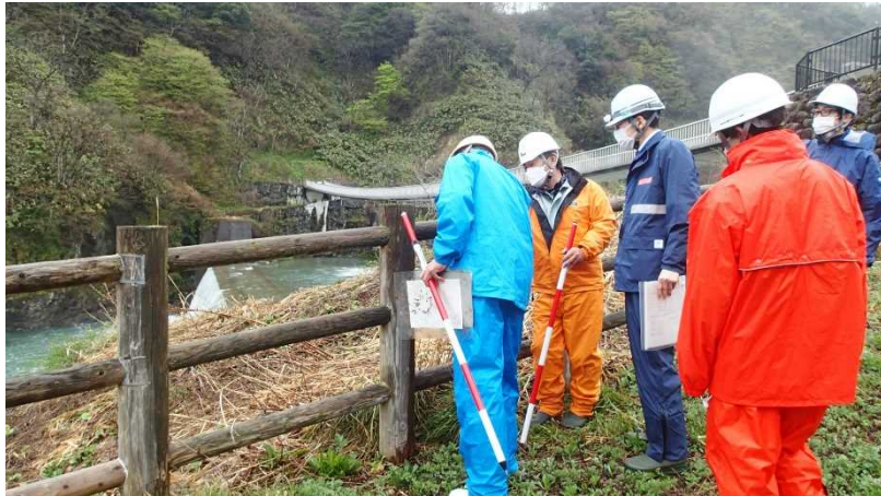
安全利用点検を行う参加者 (常願寺川水辺の楽校)