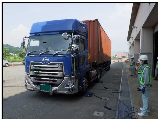
車両の重量を測定しています。