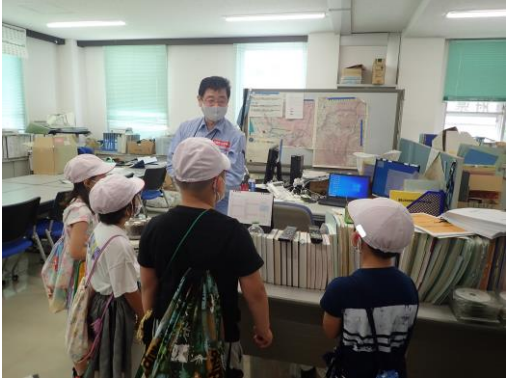
【参考】関川砂防出張所の説明

新潟県関川村立関川小学校の2年生から、学校の近くに関川“砂防”出張所ってあるけど、“砂防”ってなんだろう？出張所ではどんなことをしているの？という疑問の声が届きました。その疑問を解決するために、関川小学校「村のすてき調査隊」として、児童10名が関川砂防出張所を訪問することとなりました。 当日は飯豊山系砂防事務所の職員が、国土交通省の砂防事業や土砂災害などについて、パネルや土石流模型実験装置などを用いて説明し、児童の疑問に答えたいと考えております。 日時： 令和4年6月15日（水）11：00～11：20（予定） 場所： 飯豊山系砂防事務所関川砂防出張所（関川村大字上関1303-2） 対象： 関川村立関川小学校2年生 10名 ※「村のすてき調査隊」は、生活科「村探検」授業の一環と聞いています。詳細については関川小学校へお問い合わせ願います。