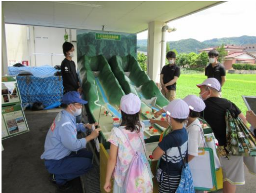
【参考】土石流模型実験装置による説明

※発熱などの症状がある方は来場をお控えください。 また、新型コロナウイルス感染防止対策の観点から、マスクの着用をお願いします。 皆様のご理解とご協力の程よろしくお願い申し上げます。