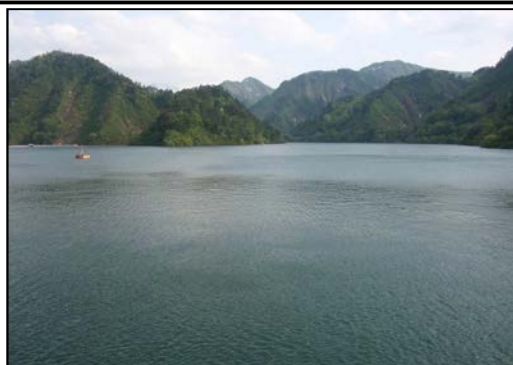
貯水位を下げる前の おおいし湖

その洪水を貯め込むための容量を確保するため、前もって貯水位の低下するものです。貯水位を低下させる事により、新潟県庁約94杯分の容量(洪水調節容量)を確保します。