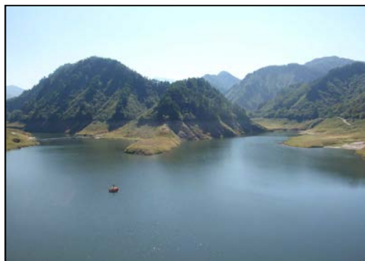
貯水位を下げた おおいし湖