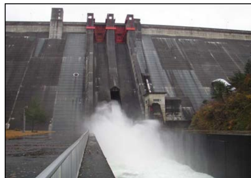
ダム放流時の様子