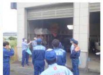
中新田災害対策機械等資材庫 (国土交通省管理)