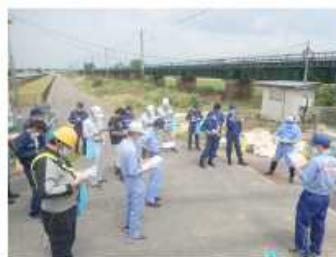
新潟市秋葉区中新田地先 (左岸18.2k)