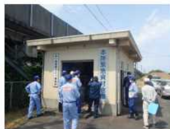
本所緊急資材倉庫 (国土交通省管理)