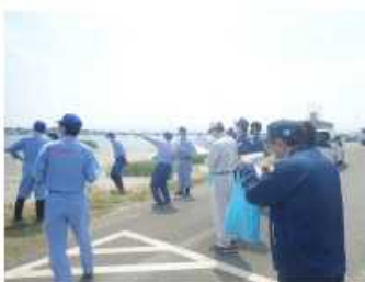
新潟市東区松浜町地先 (左岸0.1k)