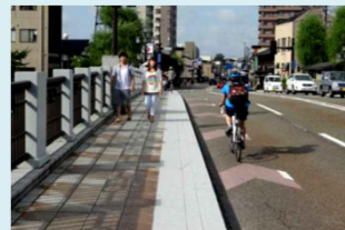
城下町の歴史文化ゾーンに定着