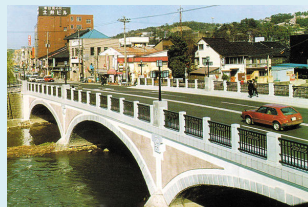
大正時代の面影を平成元年に復元