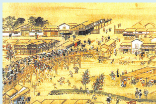
流出で幾度も架け替えられた木造橋