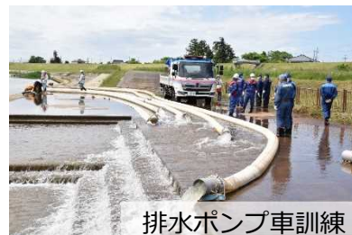
排水ポンプ車訓練