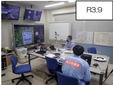
令和3年度の訓練実施状況イメージ

※発熱などの症状がある方は来場をお控えください。 また、新型コロナウイルス感染防止対策の観点から、庁舎内でのマスクの着用をお願いします。皆様のご理解とご協力の程よろしくお願い申し上げます。