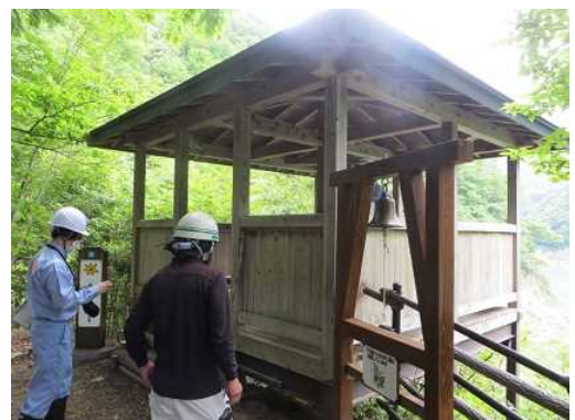
④ダム右岸管理用巡視路