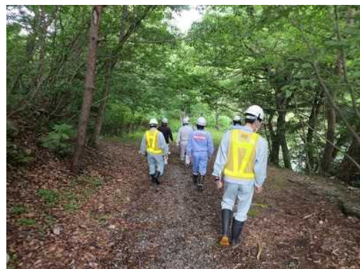
前回の安全利用点検状況(夏休み前 R3. 6. 30 実施)